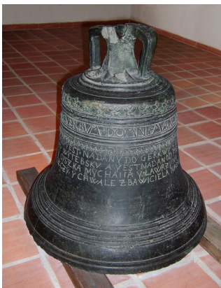
Илл. 1. Современное состояние Витебского колокола