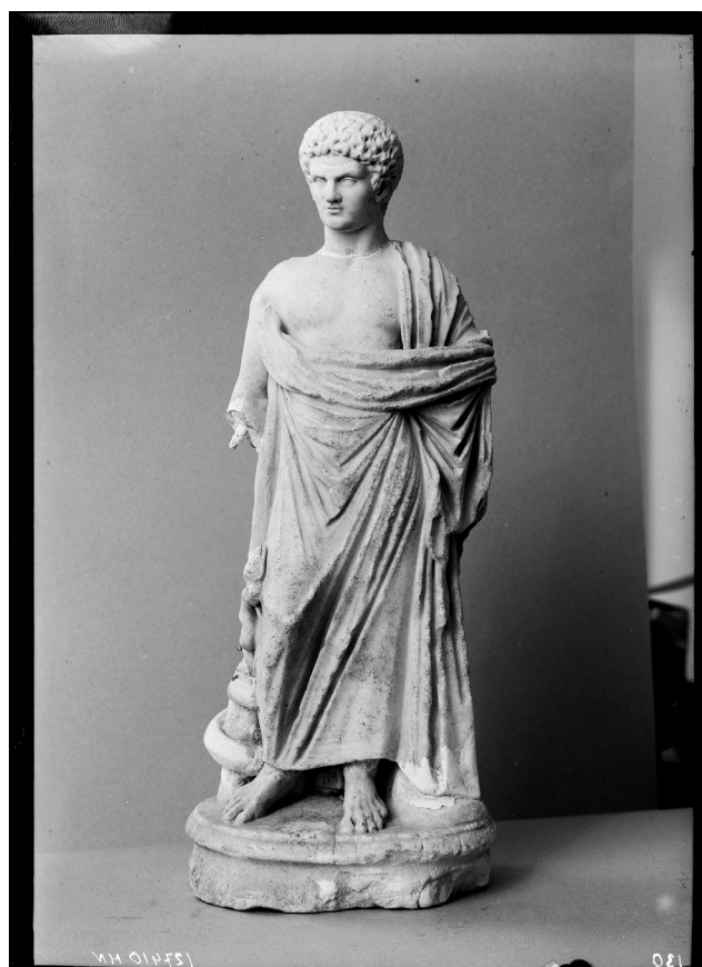
Скульптура Асклепия Национальный музей в Варшаве