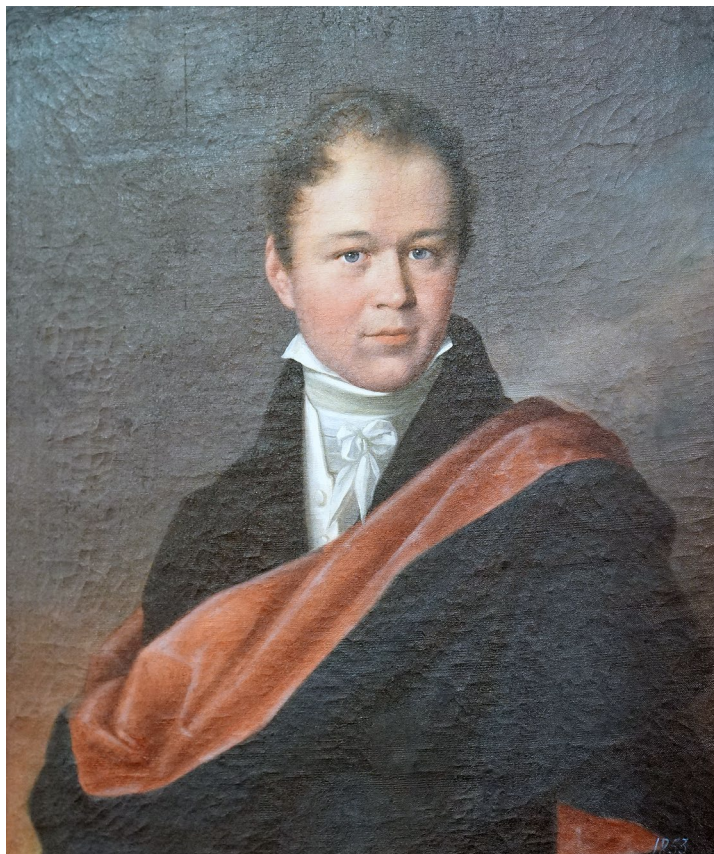
Портрет Игнатия Булгака Ян Дамель